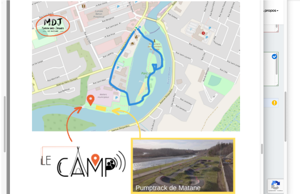
Emplacement visualisé par l'équipe de la MDJ.